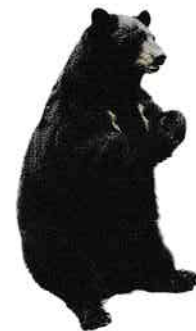
Ursul negru asiatic